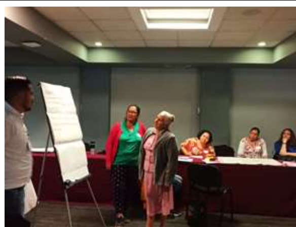
Exposición de las problemáticas ambientales de las diferentes juntas.