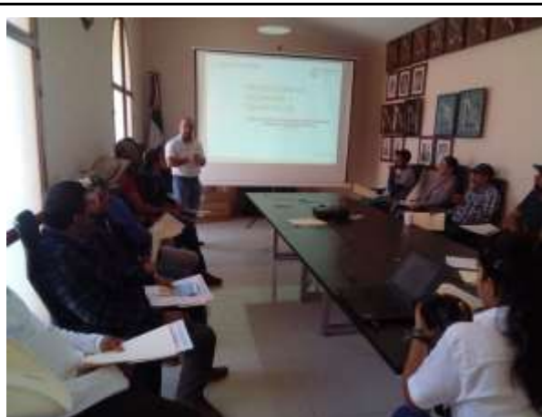
Difusión de la NOM-015 en en Municipio de Mixtlán en coordinación con CONANP.

Protegida Sierra de Vallejo-Río Ameca, se llevó a cabo la de difusión de la NOM-015-SEMARNAT/SAGARPA-2007, instrumento que regula el uso del fuego en terrenos forestales y agropecuarios en los municipios de Mascota, Mixtlán, Puerto Vallarta, San Sebastián del Oeste y Atenguillo teniendo como foro los Consejos Municipales de Desarrollo Rural Sustentable.