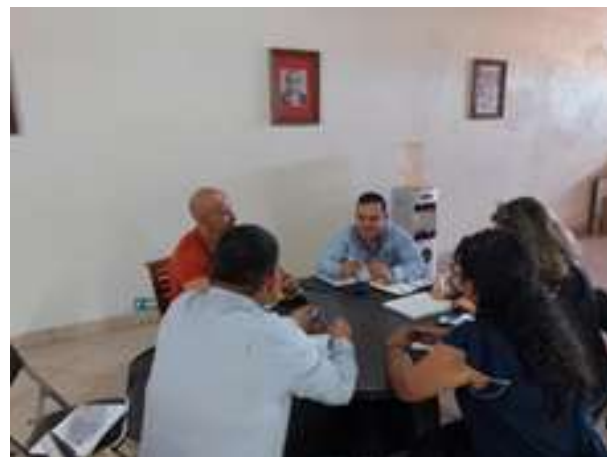
Mesa de trabajo en las instalaciones de la presidencia municipal de Mascota.