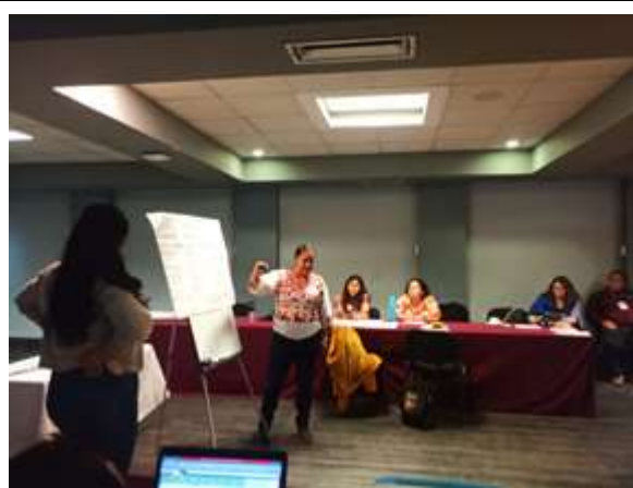
Participación de la promotora forestal del municipio de Atenguillo.