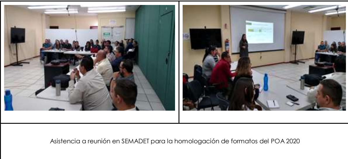
Asistencia a reunión en SEMADET para la homologación de formatos del POA 2020

Curso Básico de bomberos forestales S-130